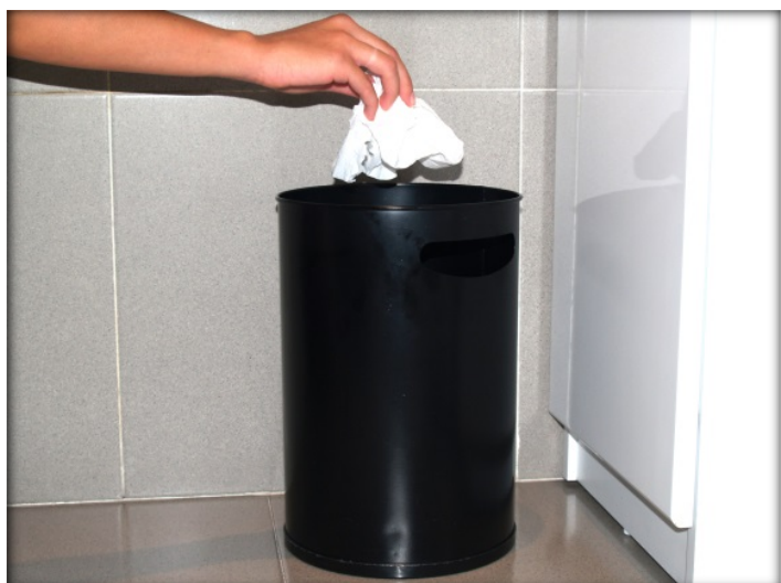
Tira la toalla a la basura