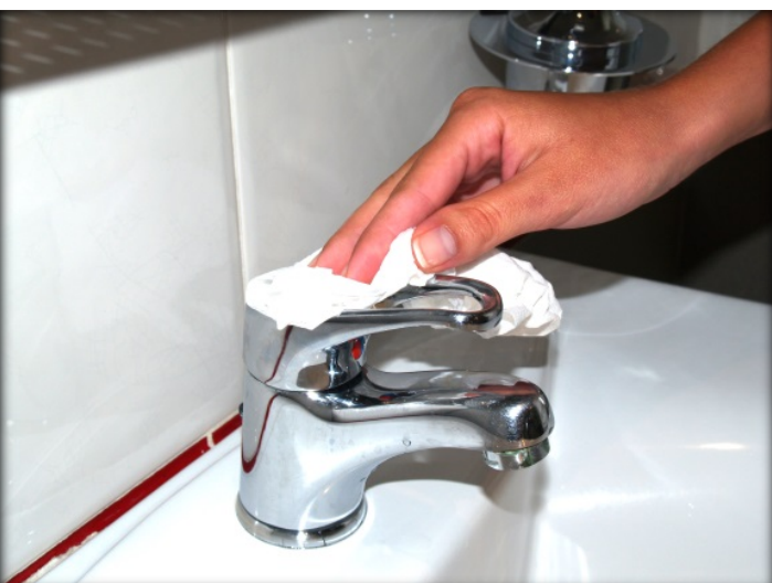
Usa la misma toalla para cerrar el grifo