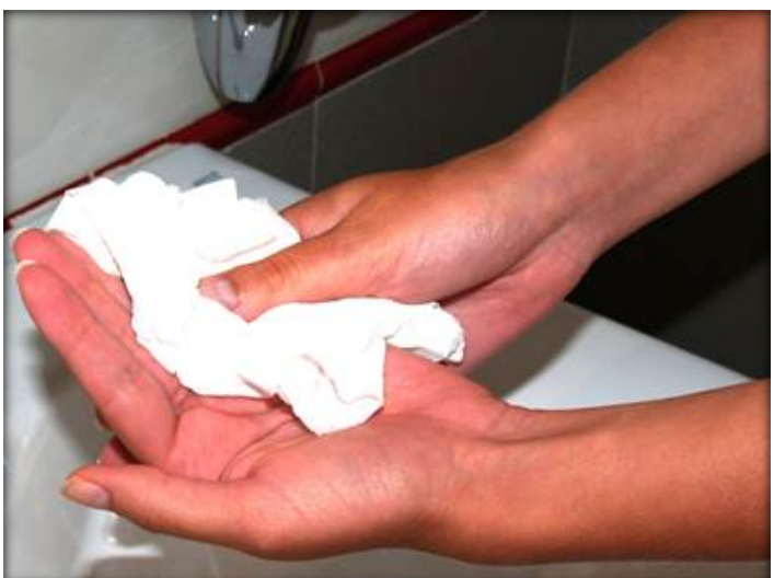
Sécate las manos con una toalla desechable