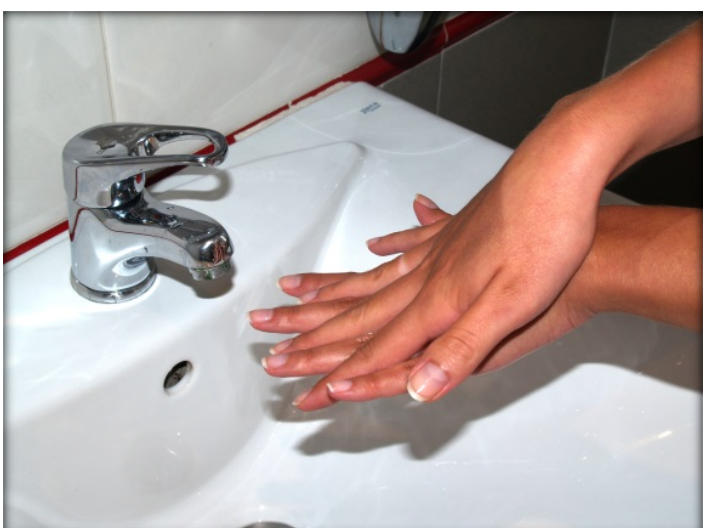
Frótate las palmas con los dedos entrelazados