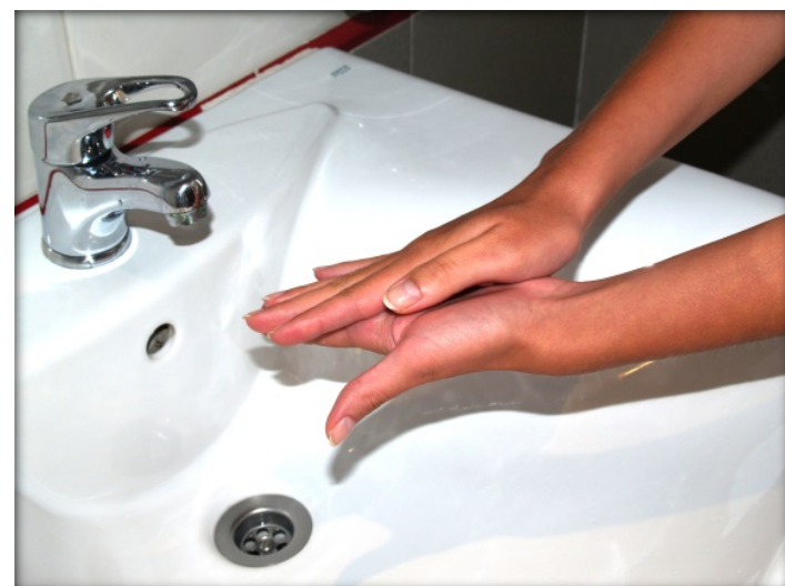
Frótate las palmas de las manos