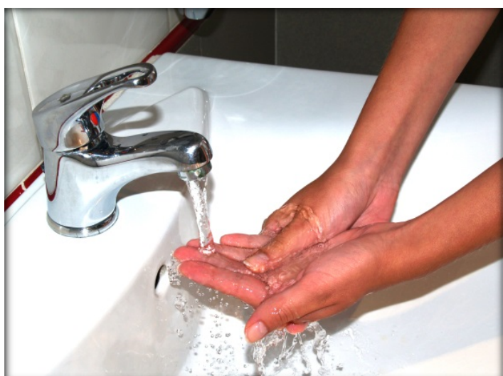
Enjuágate las manos con agua